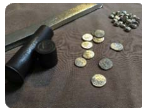
Atelier lampe à huile, fibule et monnaie : Site du Fâ